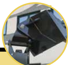
Plate with adapter for quick coupler

Piastra di aggancio per minipala, pala, terna e telescopico