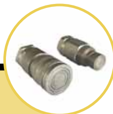
Kit innesti rapidi da 3/4" S.F. 3/4" S.F. quick couplers kit