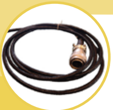
Connettore a 8 o 14 poli Connector with 8 or 14 poles